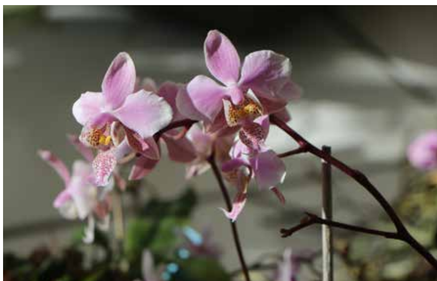
Au coin de l'appartement de Luc Vincent, une orchidée de sa création.