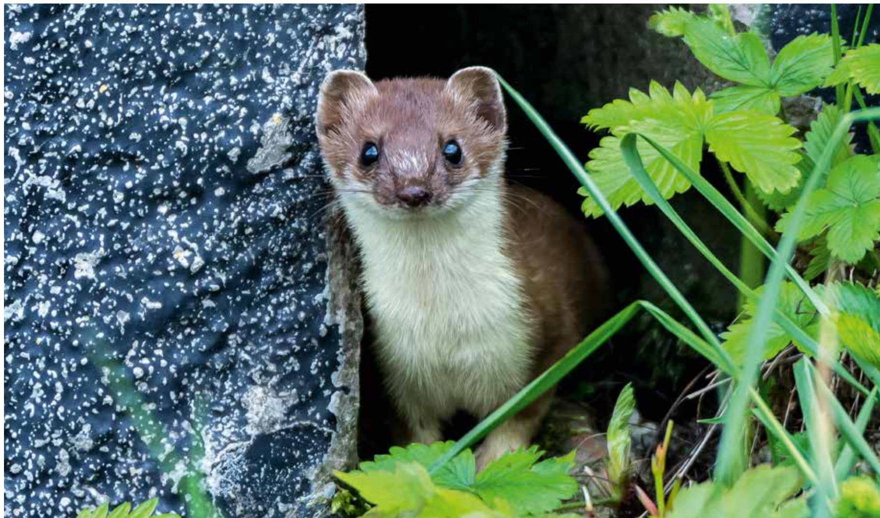
L'hermine: une espèce locale à découvrir en photo lors de l'exposition proposée au Moulin de Bayerel par le naturaliste Pascal Aeby. (voir agenda page 7).