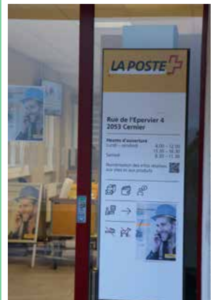
Travaux terminés à la poste de Cernier..

Il est vrai que la fermeture des petits offices postaux, comme celui de Savagnier par exemple, ne réjouit pas la population qui doit modifier ses habitudes. En revanche, à travers cet investissement sur le site de Cernier, la Poste prétend démontrer que ses filiales restent l'épine dorsale de son réseau. Elle désire d'ailleurs élargir dans le même temps ses nouveaux bureaux aux prestataires sectoriels (banques, assurances, caisses-maladie). Elle a déjà investi 40 millions de francs dans la modernisation de près de 300 filiales en exploitation propre. A ce jour, environ 220 d'entre elles ont déjà fait l'objet d'une transformation au niveau suisse, dont six sur territoire neuchâtelois et une au Val-de-Ruz. /comm-pif