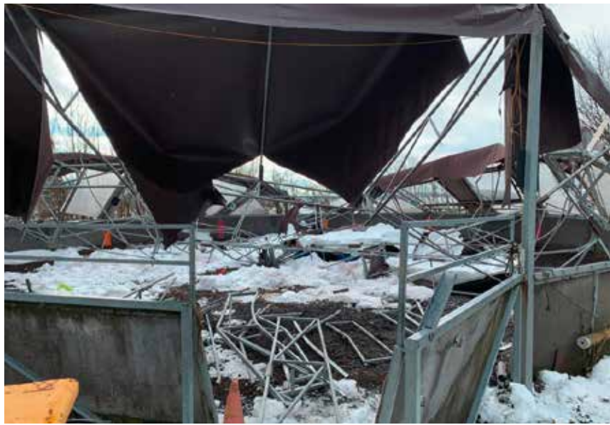
Le toit s'est effondré sous le poids de la neige.