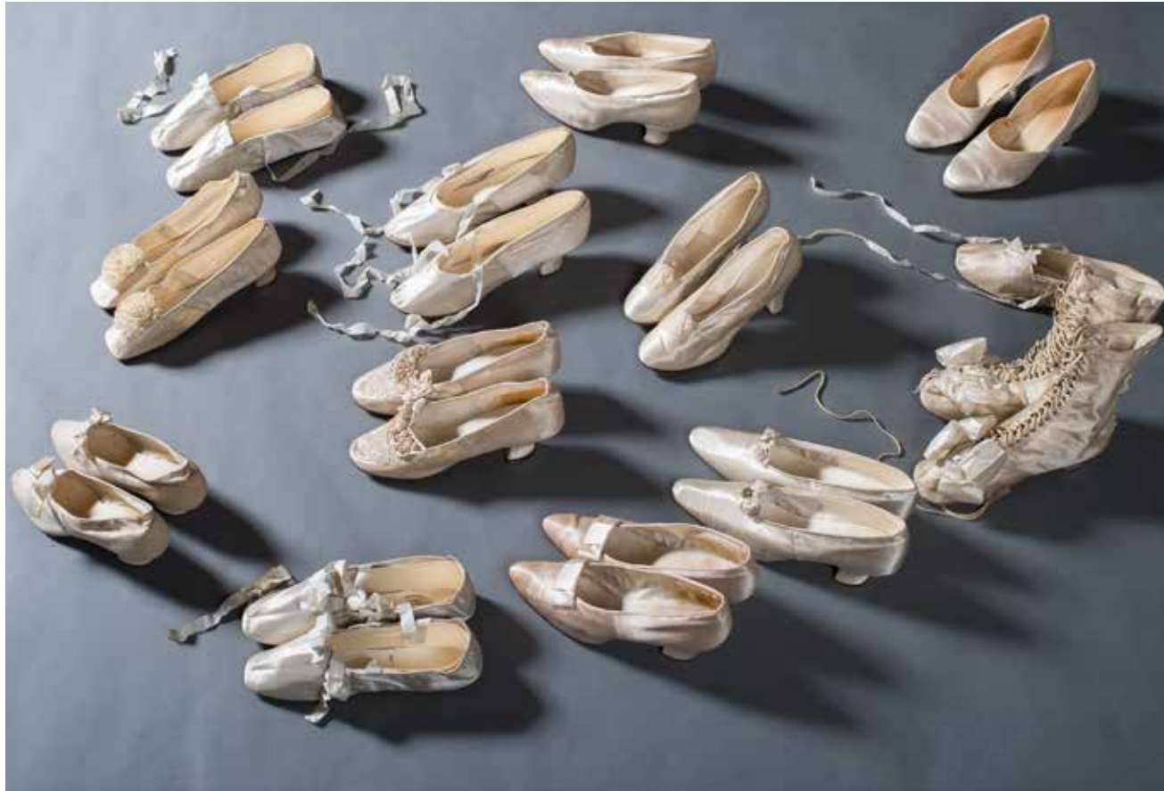
A découvrir au Château et Musée de Valangin, une exposition autour du blanc..