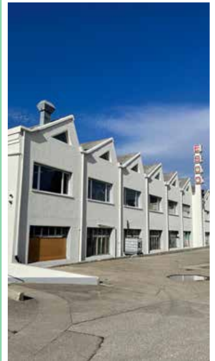
De quoi faire la fierté du propriétaire des lieux.

Aujourd'hui, ces bâtiments ont été rénovés et ils ont reçu un sérieux coup de peinture fraîche, qui offre une blancheur éclatante et un air de dynamisme nouveau au site. /pif