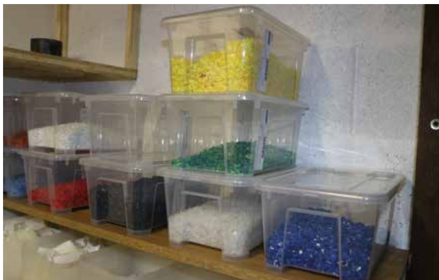
Les déchets en plastique sont répartis par couleur et broyés. (Photo pif).

Les Lambercier ont lancé leur opération l'automne dernier sous l'appellation